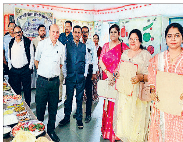
विजयी प्रतिभागियों को पुरस्कृत किया गया।