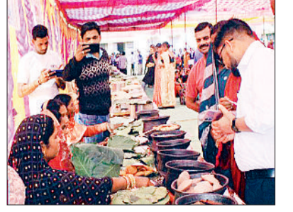
हरिभूमि न्यूज कवर्धा

के 72 गांवों से 90 महिला समूहों एवं किसान समूहों से लगभग 1200 लोगों की टीम शामिल हुई। जेवनार मेले में 150 से ज्यादा परंपरागत व्यंजन स्टॉल पर प्रदर्शन किए गए। जेवनार मेले का शुभारंभ परम्परागत आदिवासी नृत्य के साथ हुआ। जेवनार मेले मिलते यानी मोटे अनाज जैसे कौदो, कुटकी, सांवा, कंगनी, बाजरा आदि अनाजों को अपने खाने में शामिल करने के महत्व को बढ़ावा देने के लिए